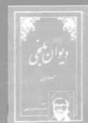
۷- دیوان بلخی، چاپ ۱۳۳۸، ص ۱۰

مستضعفین (نشریه سازمان نصر افغانستان در خارج از کشور)، شماره مسلسل ۵۷-۵۸، اسد ۱۳۵۸، ص ۷۷.