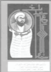
۴- چنگ‌های بلخی، چاپ ۱۳۳۸، ص ۱۰