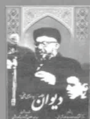
۸- دیوان بلخی، چاپ ۱۳۳۸، ص ۱۰