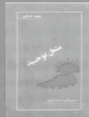
۵- مشعل توحید، چاپ ۱۳۳۸، ص ۱۰