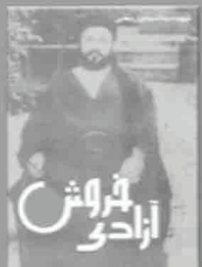
۶- خورش ازادی، چاپ ۱۳۳۸، ص ۱۰