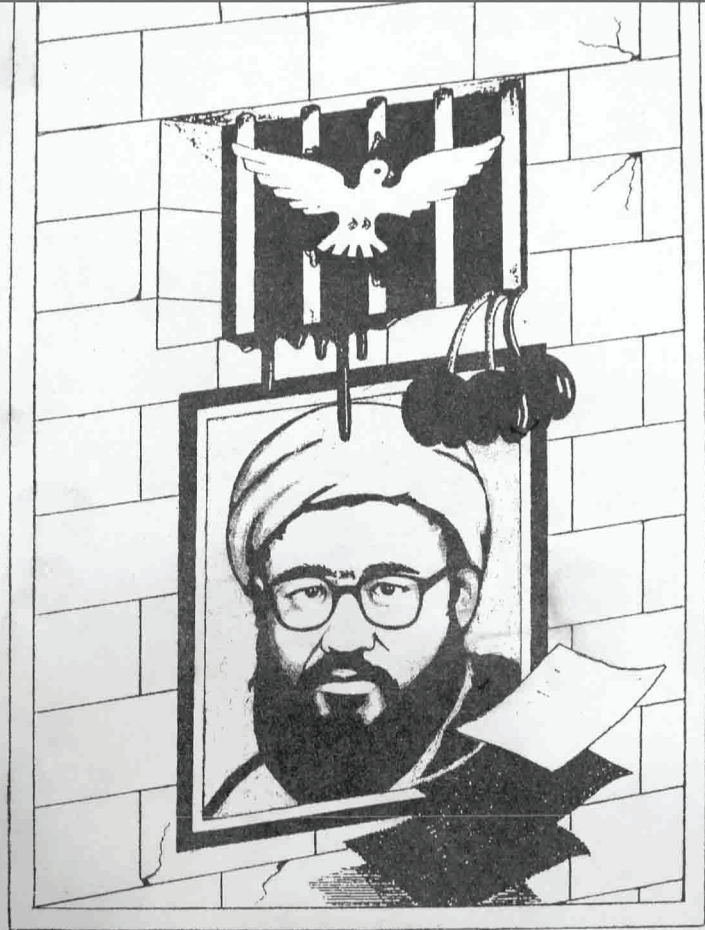
به مناسبت سی و هشتمین سالگرد آزادی علامه شهيد بلخي (ره) از زندان دهمزنک کابل پس از يازده سال در تاريخ ۱۳۴۳/۷/۱۱