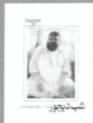
۳- شب ۵ بهجور، چاپ ۱۳۳۸، ص ۱۰