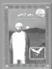
۹- دهی آزادی، چاپ ۱۳۳۸، ص ۱۰