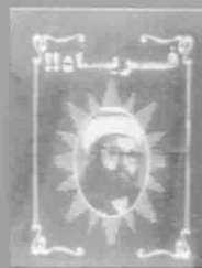
۲- فریاد، چاپ ۱۳۳۸، ص ۱۰