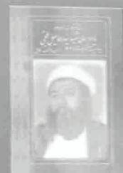
۱- یادای از شهید بلخی، چاپ ۱۳۳۸، ص ۱۰