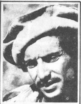
السيد احمد شاه مسعود

٢- ان عدم الاعتراف بدور الشيعة فى افغانستان واخذهم كواقع فى الساحة الافغانية من خلال حضورهم الدائم والقوى فى الجهاد الافغانى وتحرير مناطقهم