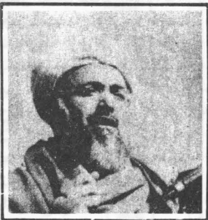
السيد برهان الدين رباني

والقى السيد صبغت الله محددى كلمة في هذا الاجتماع شكر فيها الدكتور ولايتى وزير خارجيه على جهوده لجمع صفوف قادة المجاهدين الافغان ، وقال