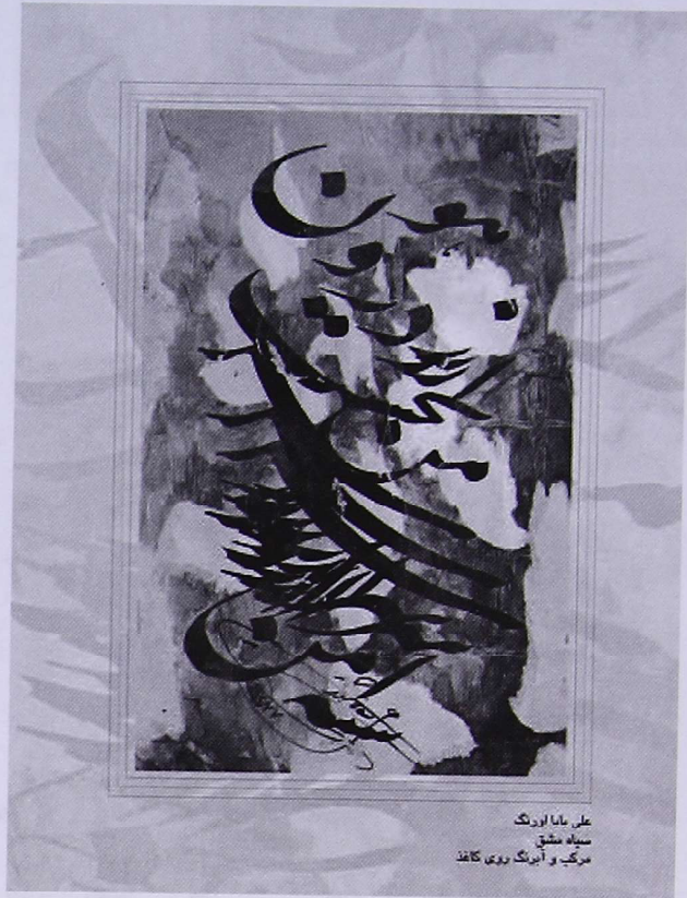
عطر، بانایا اوردنگ سیاه مشق مرکب و آبرنگ روی کاغذ

می‌گیرد و سال‌ها جنگ و نزاع و کشمکش‌ها بر این هنر ناب تأثیر گذاشته است و امروزه آن شأن و شوکت و جایگاه گذشته‌اش را ندارد. غیر از جنگ‌ها، عوامل دیگری هم در کسادی بازار این هنر تأثیر داشته و از جمله بیشترین تقصیر به خوشنویسان ما برمی‌گردد. خوشنویسان ما هم به روزمره‌گی گیر مانده‌اند و نتوانسته‌اند کاری در این عرصه انجام دهند. ادعای تقدس و سنت‌گرایی محض هم دلیل دیگری بر تبعید این هنر است. با تمام مشکلاتی که دامن‌گیر این هنر فخیم و زیبا شده، اگر امنیت در کشور برقرار شود، این هنر اعتبار از دست‌رفته‌اش را باز می‌یابد؛ زیرا مردم ما از این هنر، خاطره‌های شیرین و مانای فراوان دارند. امیدوارم مردم عزیز افغانستان مثل خط نستعلیق، زیبا و صمیمی باشند و پس از این، سلام و مهربانی را تجربه کنند که صفت بندگان درگاه اوست.