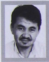
علی بابا اورنگ