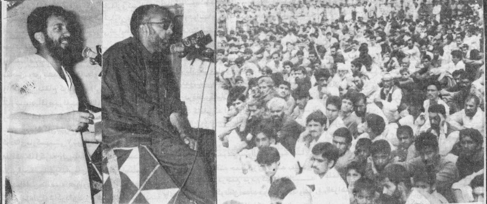
در عکس مجمع شیعیان کشمیر برادر ایام غاشورای حسینی مشاهده میفرماید